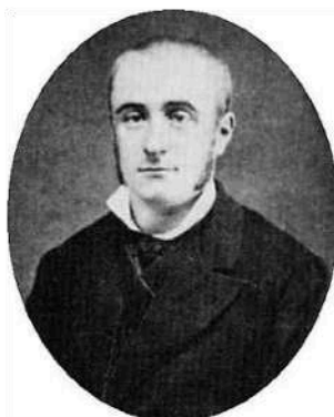
Ernest Delahaye 1853 -1930