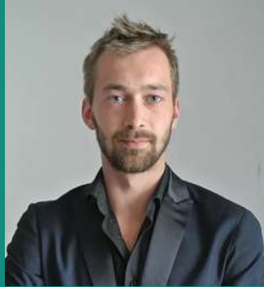
Basilien Foresiier Scénographie - Costumes