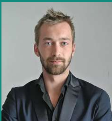
Bastien Forestier Scénographie - Costumes