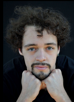
TOM BÉRENGER Comédien