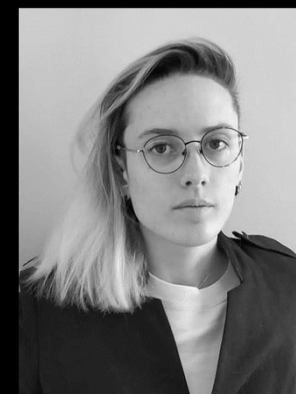
BERTILLE FRIDERICH Création lumière